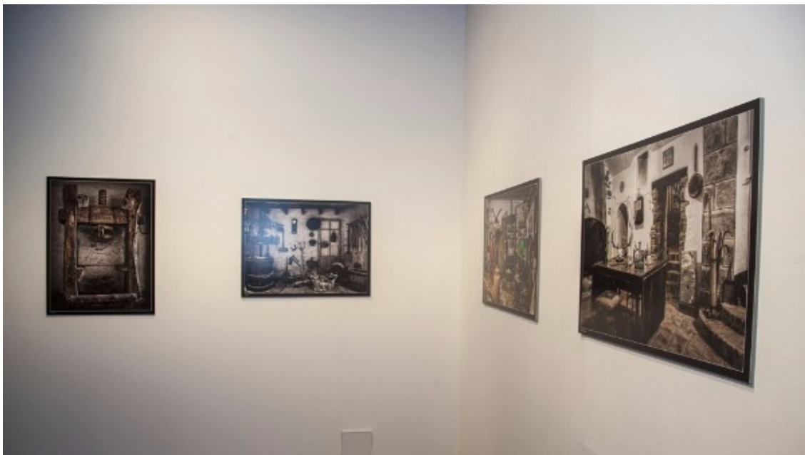
PHOTO: Ville de Just Desvern | FOTO: Ayuntamiento de Sant Just Desvern