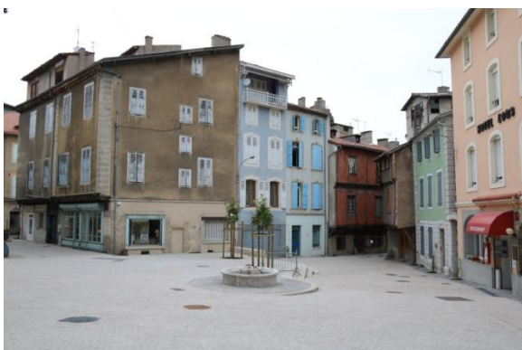
Place Dutilh, Foix