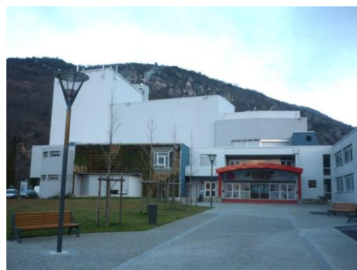
Centre culturel, Foix