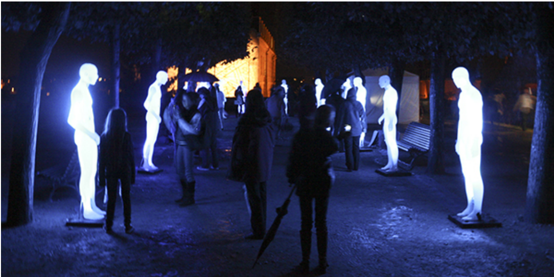
PHOTO: Les hommes debout (AADN – Arts et Cultures numériques) | FOTO: Los hombres de pie (AADN – Arts et Cultures numériques)