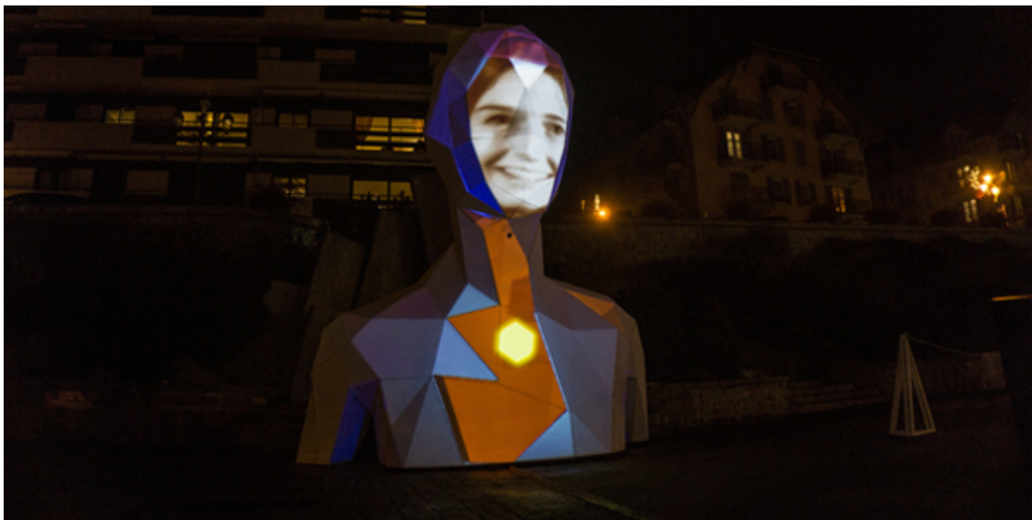
PHOTO: Installation monumentale «Face» - Fées d'hiver | FOTO: Instalación monumental "Cara" - Fées d'hiver